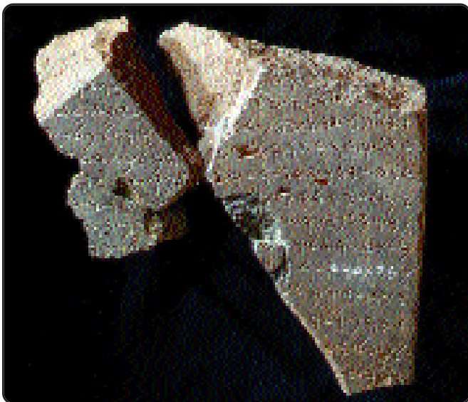
Estos fragmentos de una inscripción hallada en la región del Dan bíblico comprueban que el rey David fue un personaje histórico. La inscripción menciona la “casa de David”, la dinastía que él fundó.

Unos siglos antes, Josué había intentado conquistar esa ciudad, pero fracasó: “A los jebuseos que habitaban en Jerusalén,