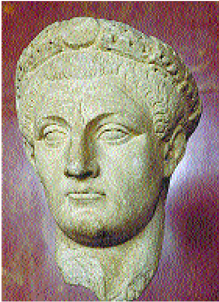
El emperador romano Claudio expulsó a todos los judíos de Roma en el año 49 d.C.

muerte de Claudio en el año 54, volvieron a Roma y fueron incluidos en los saludos que Pablo les mandó a los santos que estaban en esa ciudad (Romanos 16:3).