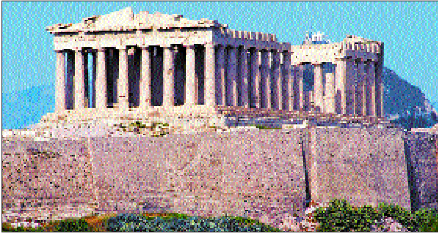
Irritado por la desenfrenada idolatría de los atenienses, el apóstol Pablo se enfrentó con ellos en la colina de Marte. Muy cerca de ese lugar estaban el Partenón (arriba), dedicado a la diosa Atenea, y otro templo más pequeño dedicado a la diosa Niké (derecha).