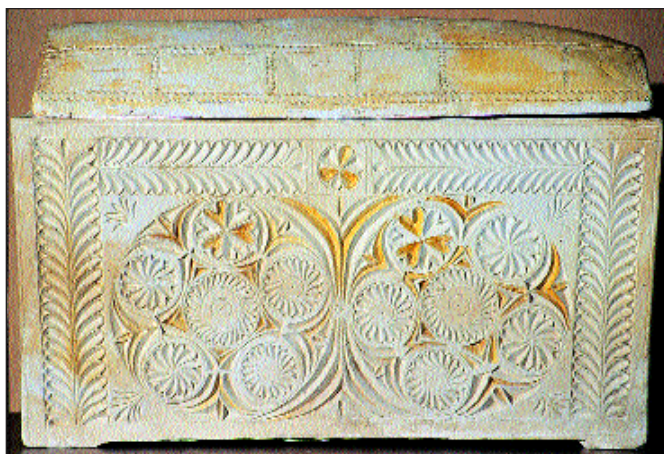
El sumo sacerdote que urdió la muerte de Jesús se llamaba Caifás. En 1990 los arqueólogos descubrieron el sepulcro familiar del sumo sacerdote y este osario que lleva su nombre.

Filón, filósofo judío de Alejandría (20 a.C.-50 d.C.), describe a Pilato como un hombre “muy inflexible, despiadado y obstinado”. De hecho, menciona que las características del gobierno de Pilato eran “la corrupción . . . la insolencia . . . la crueldad . . .